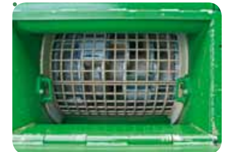
Rotor mit Siebeinsatz