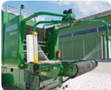
Wicklereinheit, Netz- und Folienverpackung