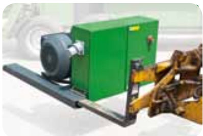
Elektro- oder Dieselmotor wählbar