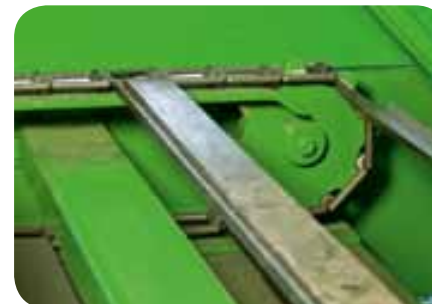
Förderbänder mit HV-Gliederkette