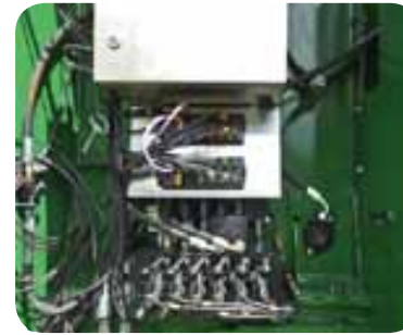
Hydraulik und Rechnersteuerung