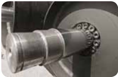
Presskammerwalzen mit durchgehender Welle und austauschbaren Verschleißbuchsen