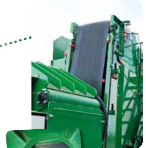
Bio-Masse-Hacker und Steigband